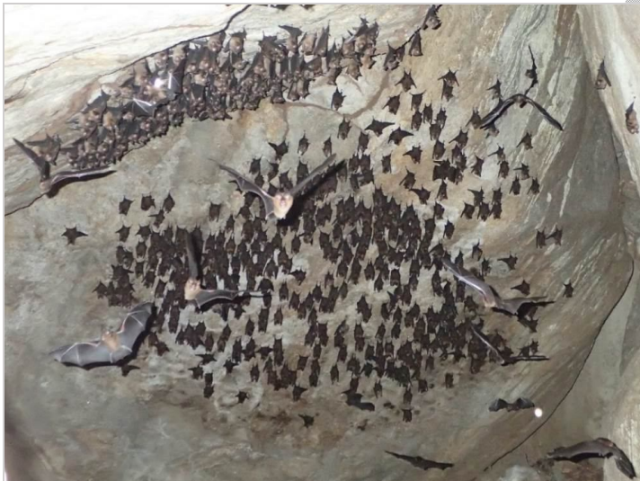
Hình 2. Một nhóm cá thể thuộc đàn dơi ở hang gần khu vực Bãi Hương