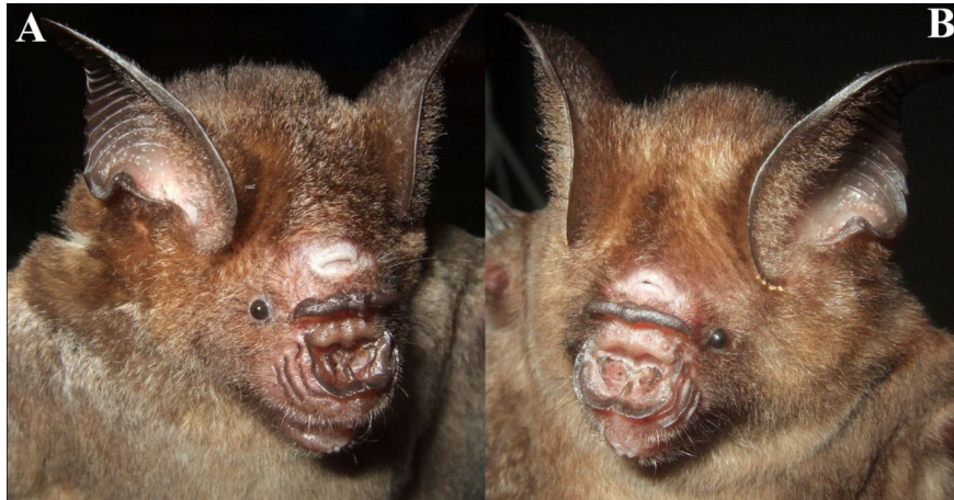
Hình 1. Hình thái ngoài của Hipposideros larvatus (A) và H. grandis (B)