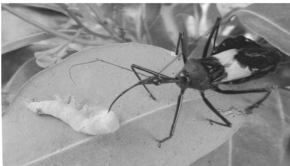
Hình 4. Cá thể trưởng thành của bọ xít CNĐCVC S. croceovitatus Dohrn. đang ăn ấu trùng sâu xanh bướm vàng xám