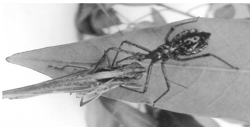
Hình 3. Ấu trùng của bộ xít CNĐCVC đang ăn châu chấu