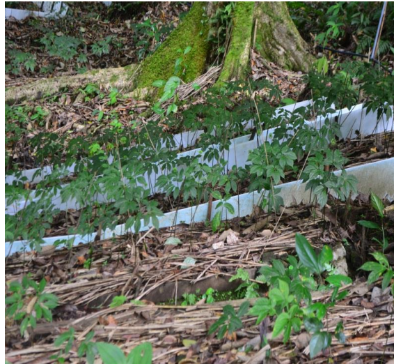
B. Hình ảnh cây sâm ngọc linh tại vườn sâm Măng Ri, Kon Tum