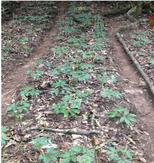
A. Hình ảnh cây sâm Ngọc Linh tại vườn sâm Tắc-ngo, Quảng Nam

trong 10' với tổng số 35 chu trình. Điện di sản phẩm PCR trên máy điện di mao quản Qiaexcel, đọc kết quả bằng phần mềm Gene Marker.