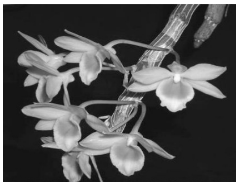
Hình 1. Cây phong lan hoàng thảo sấp ( Dendrobium crepidatum Lindl.& Paxt.)