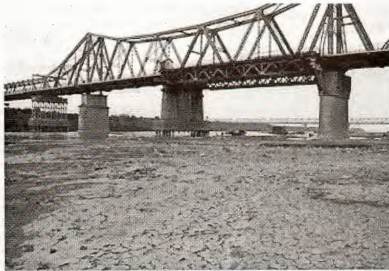
Hình 1. Sông Hồng cuối tháng 3 năm 2005