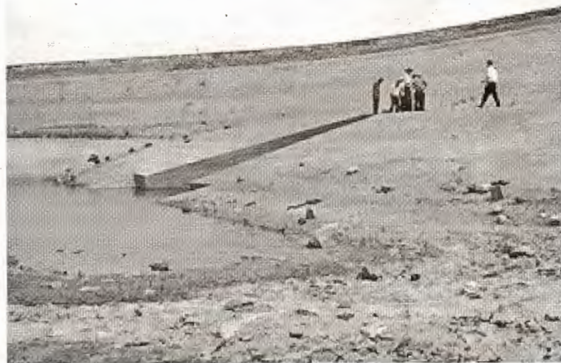
Hình 2. Hồ Cam Ranh trơ đáy cuối tháng 2 năm 2005