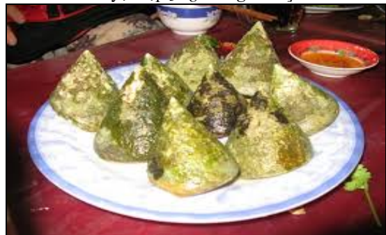
Độc đáo món ốc vú nàng trên đảo Cù Lao Chàm