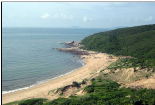
Bãi tắm hoang sơ trên đảo Vinh Thục