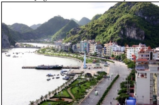
Trung tâm du lịch thị trấn Cát Bà