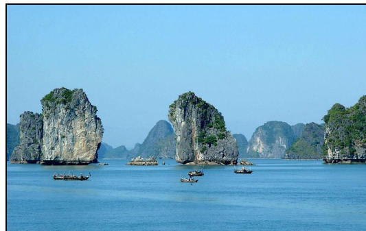
Vịnh Hạ Long nổi tiếng với những hòn đảo tuyệt đẹp