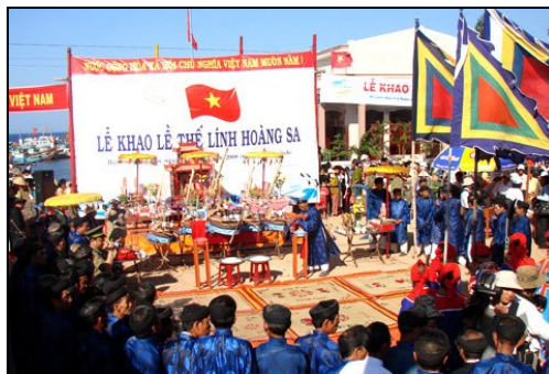
Lễ khao lễ thệ lính Hoàng Sa trên đảo Lý Sơn