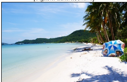
Bãi Sao trên đảo Phú Quốc