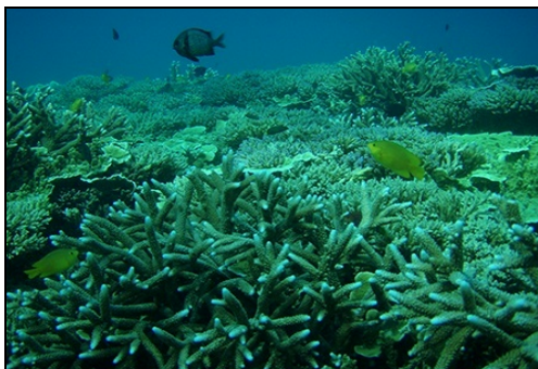
Rạn san hô Vườn Quốc gia Côn Đảo